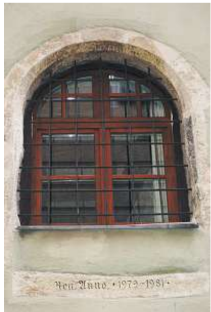
Eines der Anwesen in der Westnerwacht, das dem Passanten an der Fassade Auskunft über die letzte Sanierung gibt.

Ensemble als Einzeldenkmale geführt. 1975 wird das gesamte Stadtzentrum (rund 350 Hektar) zum Untersuchungsgebiet.