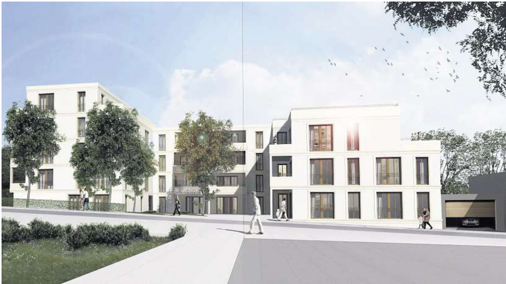
Die modifizierte Version der neuen Seniorenwohnanlage in der Simmernstraße