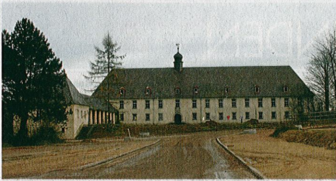
Einige der alten Gebäude auf dem Gelände der ehemaligen Nibelungenkaserne werden erhalten bleiben.