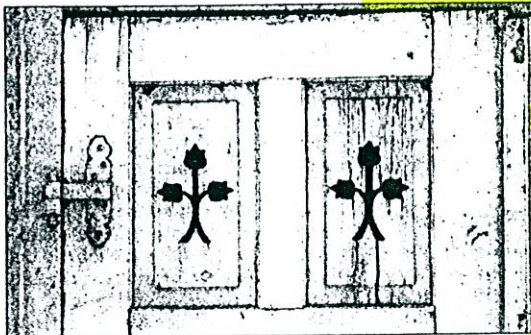
Ob die Fensterläden erhalten bleiben?